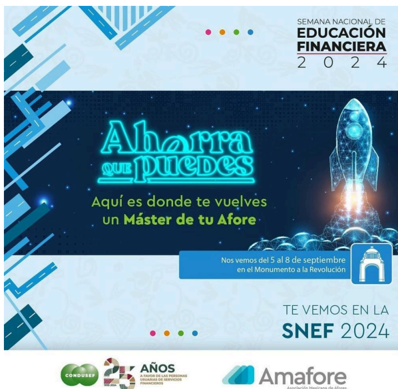
Imagen promocional Amafore / Ahorra Que Puedes en la SNEF 2024

Con el objetivo de contribuir a mejorar la salud financiera e incentivar el ahorro para el retiro, Amafore participará en la Semana Nacional de Educación Financiera 2024 , del 5 al 8 de septiembre, para que los trabajadores puedan tomar mejores decisiones financieras relacionadas con su pensión.