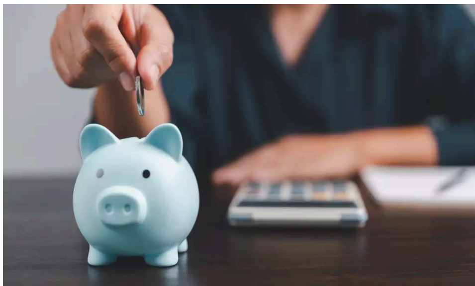
Imagen (Jinda Noipho/Getty Images/iStockphoto)

Con el objetivo de contribuir a mejorar la salud financiera e incentivar el ahorro para el retiro, Amafore participará en la Semana Nacional de Educación Financiera 2024 , del 5 al 8 de septiembre, para que los trabajadores puedan tomar mejores decisiones financieras relacionadas con su pensión.